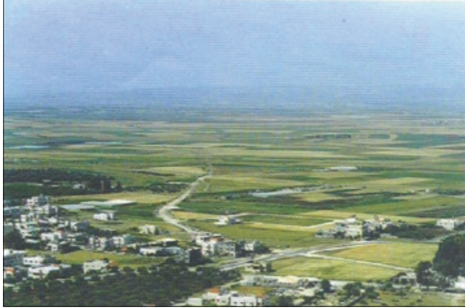
مرج ابن عامر حيث التجمعات السكانية تطعن خاصرته وتنهش ما تبقى منه

تلقت يمينا فترى أحدهم ينهمك في إنشاء «بركسات» لتربية الأغنام في عمق المرح، تبدل نظرك فتشاهد آخر يطوق قطعة ارض ابتاعها بأسلاك شائكة تمهيدا لإنشاء مسكن فيما آخرون انتهوا في فترات متعاقبة من العبث بالأراضي الزراعية وسكنوا على تربتها الخصبة... عدا عن التتمة ص ٦