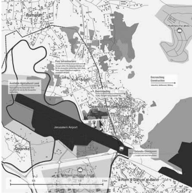
خريطة 1: موقع وحدود قرية كفر عقب